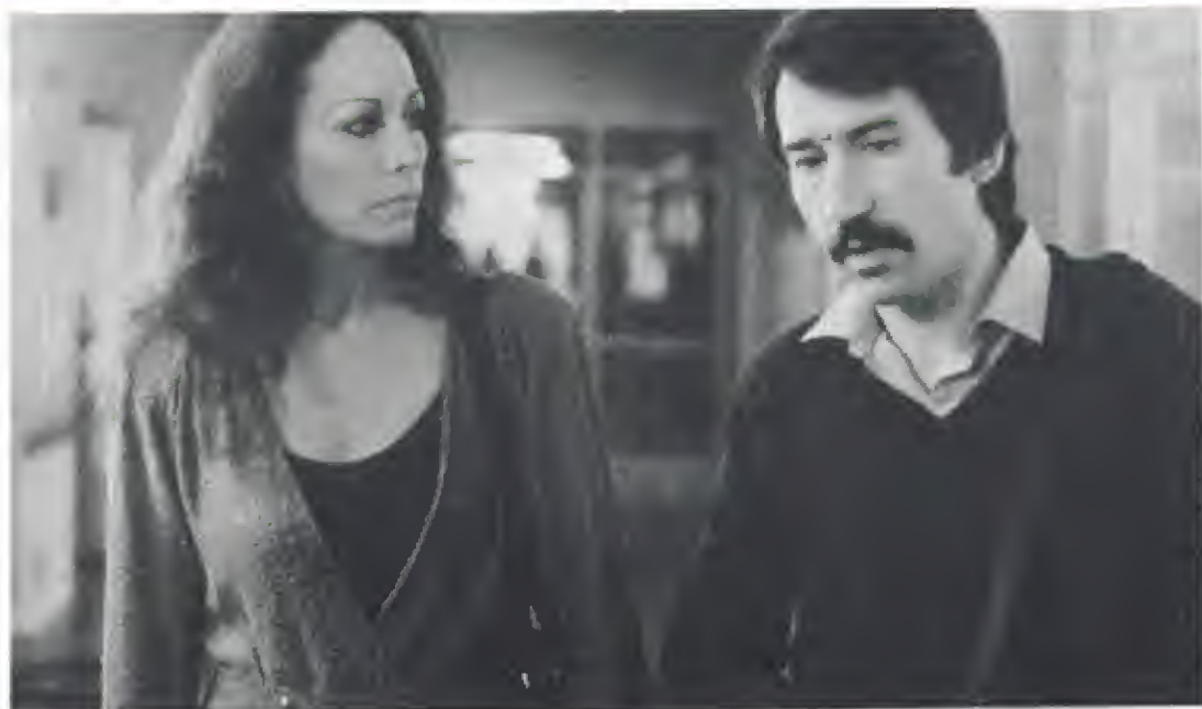
Isela Vega - José Sacristán